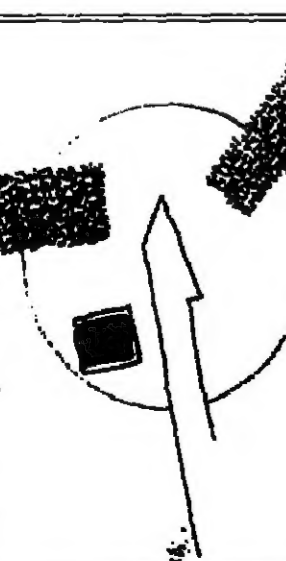
صورة من لوحة للتشوية في مجلة كتابات معاصرة